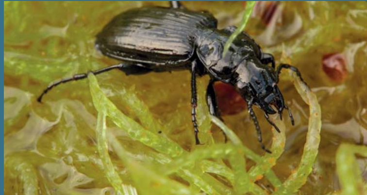
Pterostichus aterrimus

Voraussichtliches Ende der Tagung gegen 16:00 Uhr. (Programmänderungen vorbehalten!)