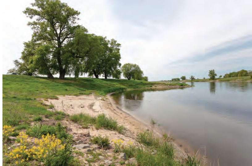
Lebensraum von Bembidion argenteolum an der Elbe